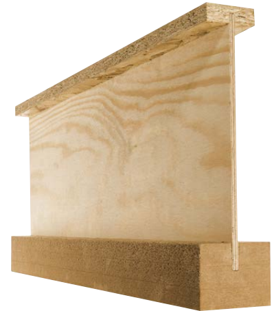
Sparrenexpander SE in Dämmplattenstreifen DP 60 eingesteckt