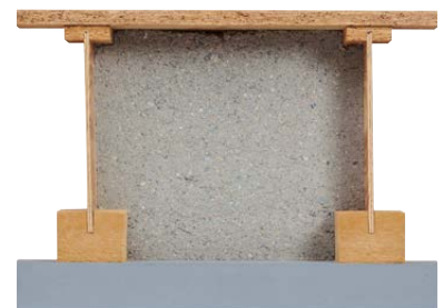
Beplanktes System mit Einblasdämmstoff