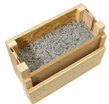
Objektbezogen fertigen wir die FT auch in Sondermaßen.